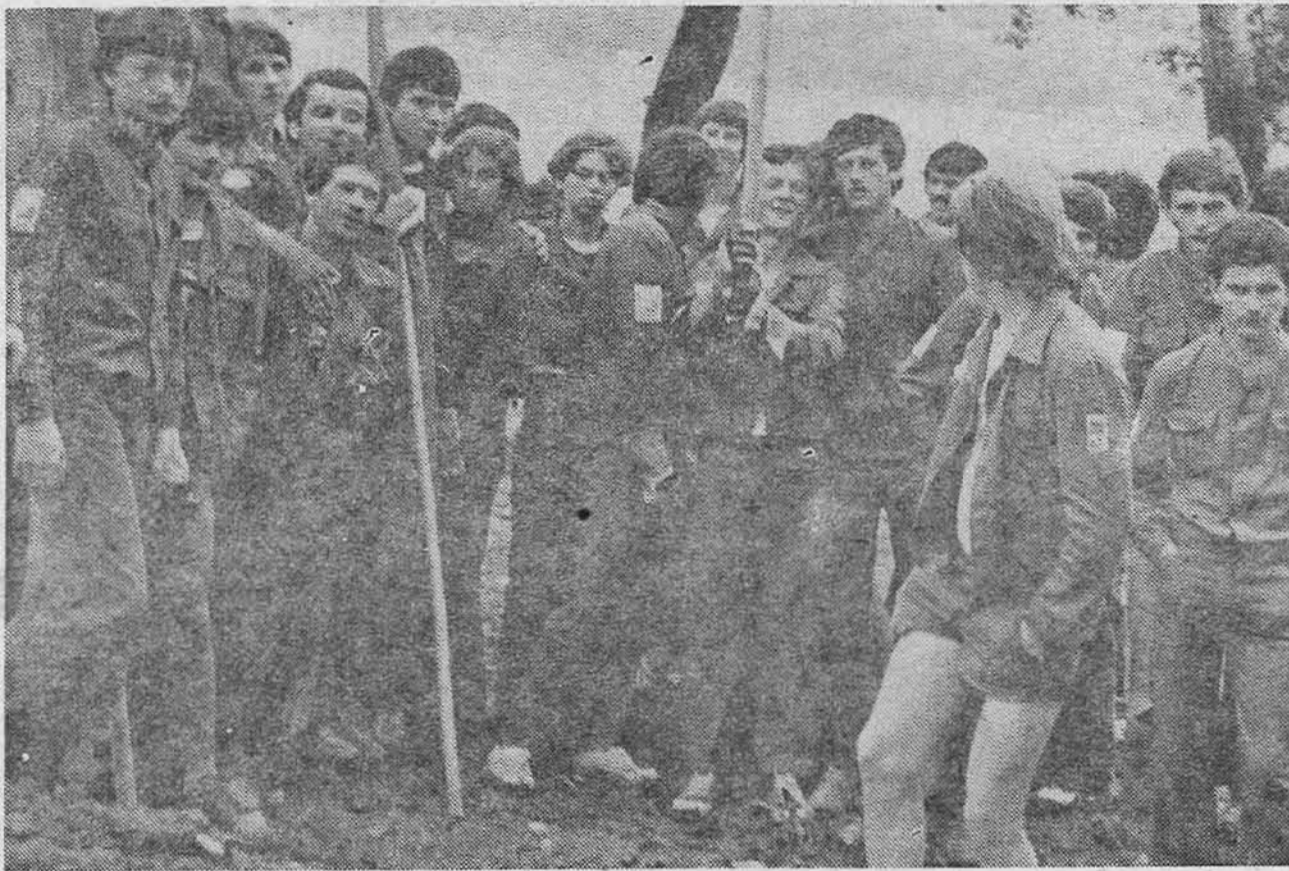
Živiničani po povratku kući

VRATILI SE ŽIVINIČKI BRIGADISTI SA ORA »BEOGRAD 78«