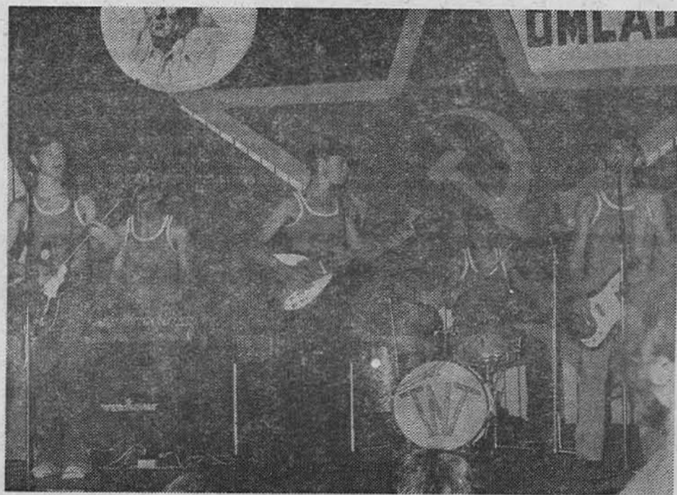
Група ТНТ на свановечерњем послу

Među brigadirima je juče i danas boravio poznati glumac Reihan Demirdžić. Gotovo svi brigadiri sa nestepljenjem očekuju njegov večerašnji nastup na naseljskoj pozornici. Ž. M.