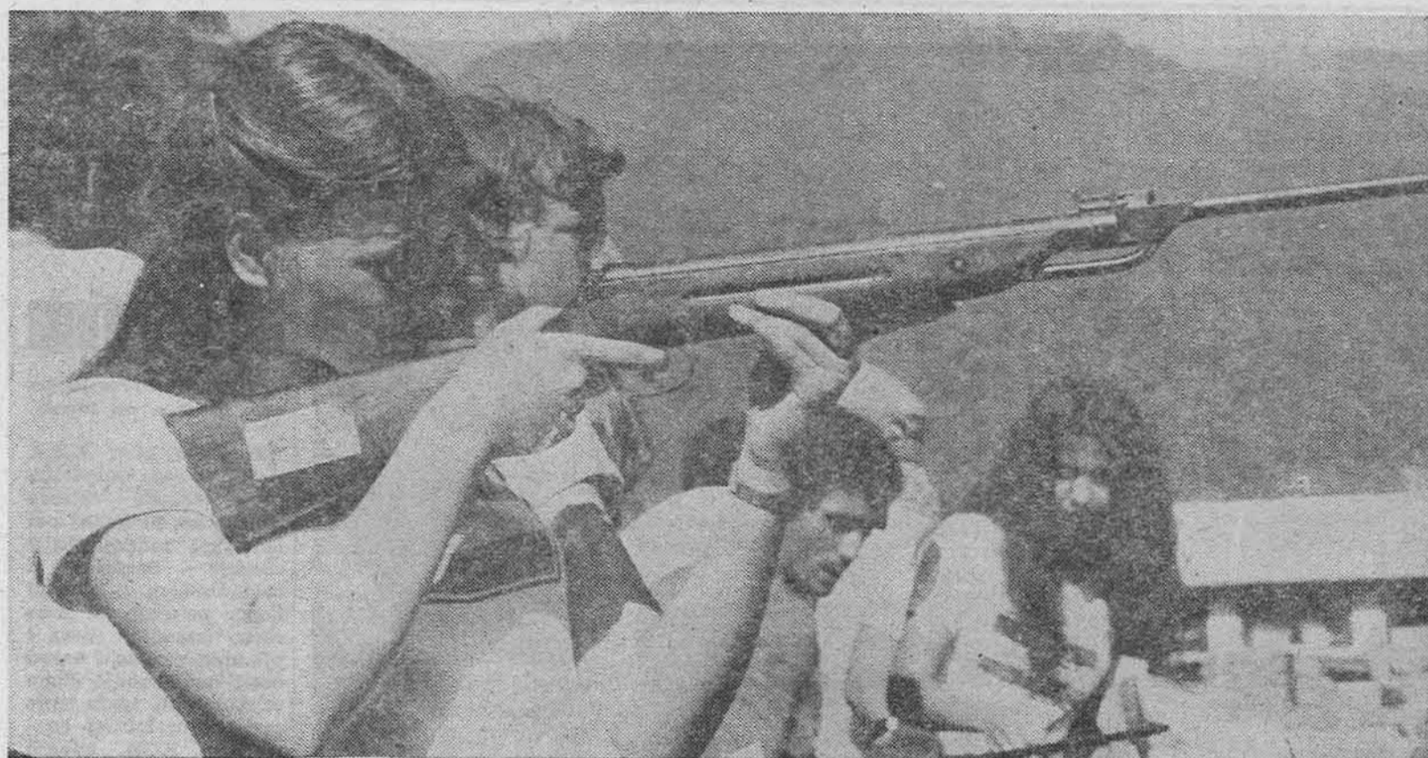
Кад нису на траси