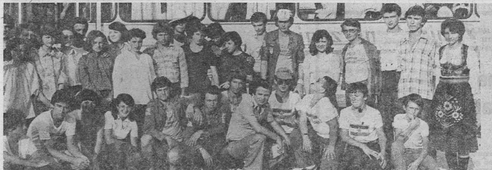
Пјесници, пјевачи, глумци, свирачи, све бригадисти из Немиле уочи одласка на ново гостовање

Културно-забавне активности у Насељу Немила