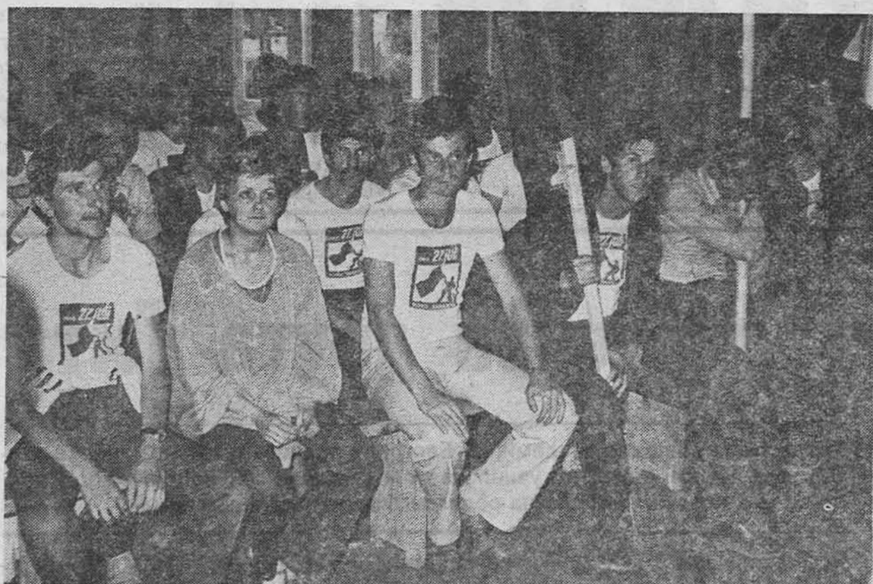
Sarajlije na SORA »Morava 78«