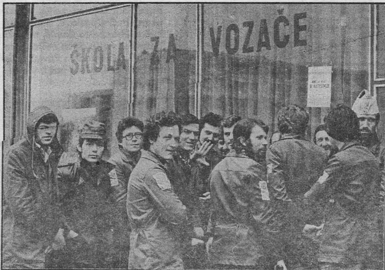
Veliko interesovanje za vozački kurs u Doboju