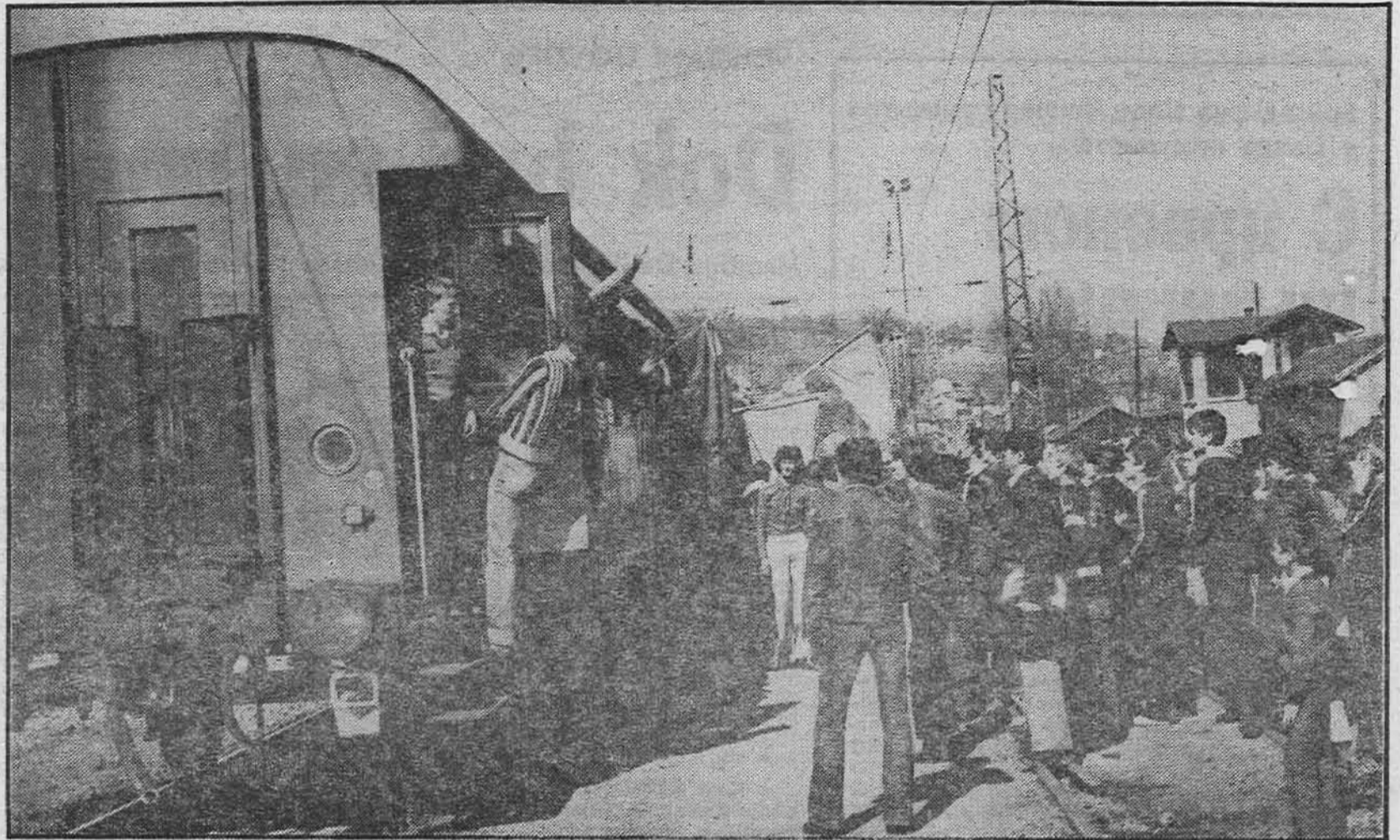
Brigadiri vozom odlaze na trasu, a ispraća ih i želi nove rekorde na desetine Zavidovičana

(Iz biltena ORB »Boro i Ramiz« naselje Zavidovići)