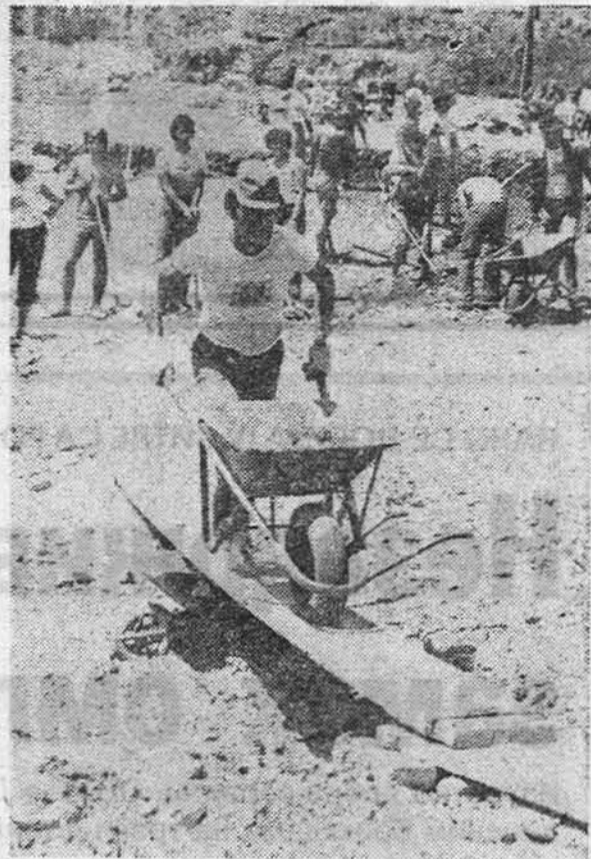
CORA »MORAVA 78«