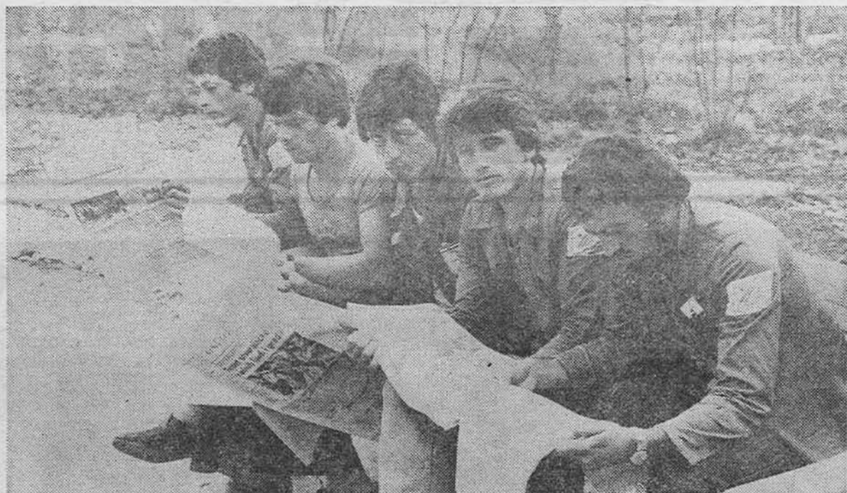
Бригадире ОРБ «Емин Дураку» с изузетном пањжом читају «Омладинску пругу»

◆ Забранјено је уносити тузне мисли у насеље ◆ Не убиј лопатом кад можеш и крампом ◆ Главни даса бригаде је економ ◆ Кад видиш да забушава лопата — крив је аšov ◆ Лјуби ближњег свог поготово ако је секретар(ца) бригаде ◆ Јављјай се увијек за požарног испред бараке гдје су на- станјене жене ◆ Забранјено је размишљати да ли је командант у праву ◆ Не супротстављјай се трасе- ру: док си на рапорту климај главом, као да ти је све јасно, чим те пусти — настјави по старом ◆ По- штуј мјере заштите на раду да не замјришеш на ро- штиљ ◆ Не иди удвоје у «шуму» — земља је мокра.