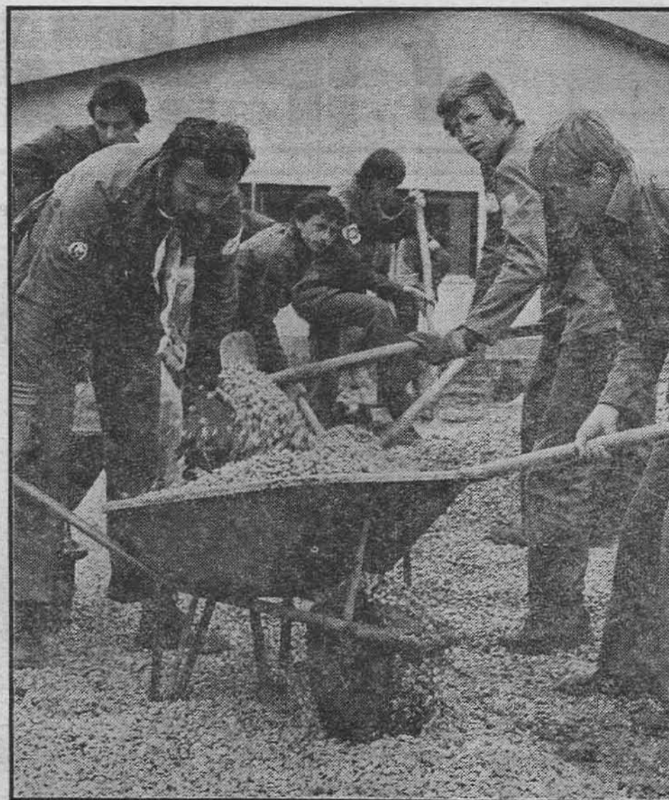
У добојском насељу ради се и над бригадирима нису на траси

— Daću sve od sebe — da me ne bi pokrali! — Puni smo utisaka — žuljeval