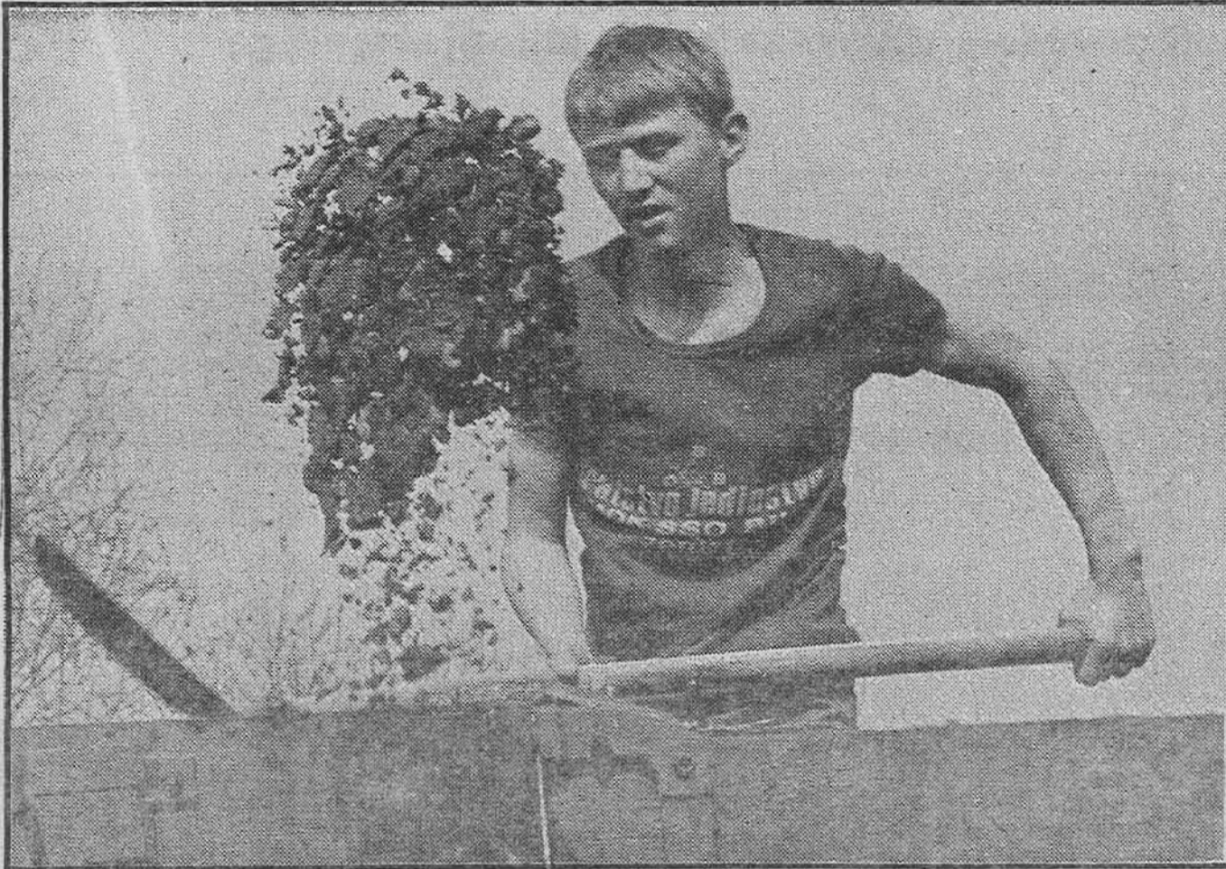
Један од најмлађих, али и међу најбољим