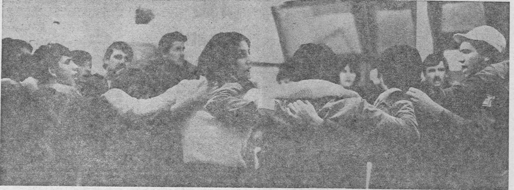
Кренуло је коло Нозарачно, анцијашко