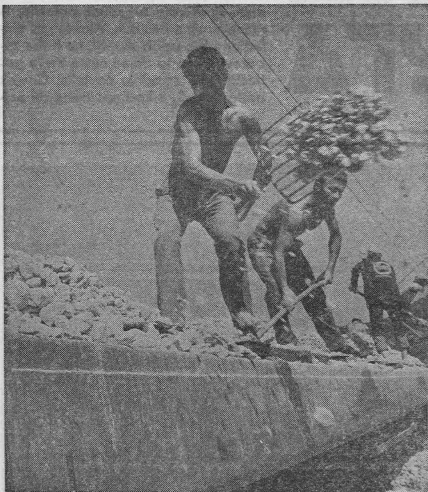
U Zavidovićima je šesta smjena počela udarnički