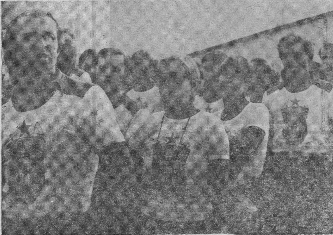
И дјевојке у строју добровољаца »Фамосове бригаде«