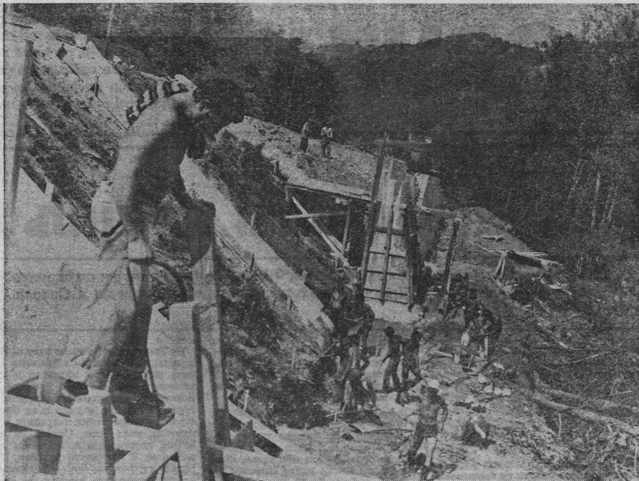
Потпорни зидови gutaju nebrojene tone бетона