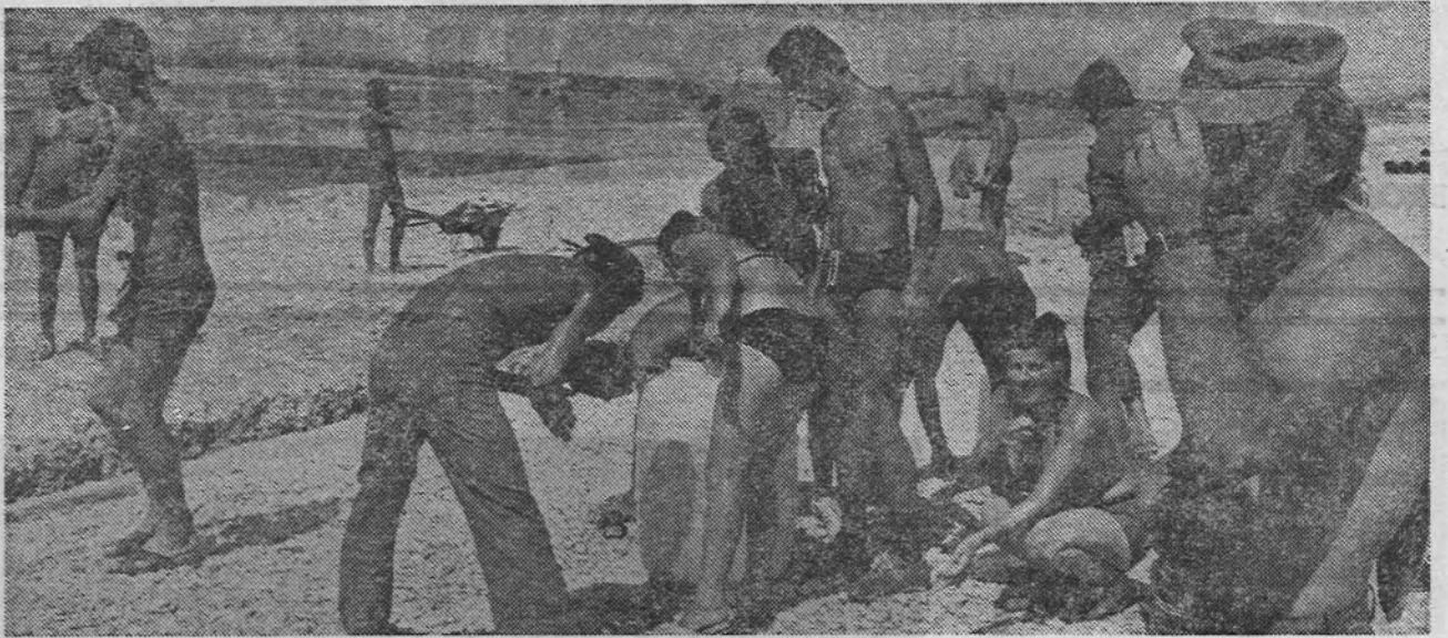
Уз просјечно извршење норме од 191 одсто било је и радости и шале

Упркос киши и све остале бригаде урадиле су значајан дио посла.