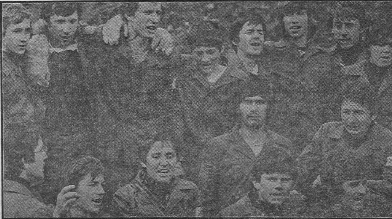
U svim naseljima mladost se veselila zbog izvanrednih rezultata