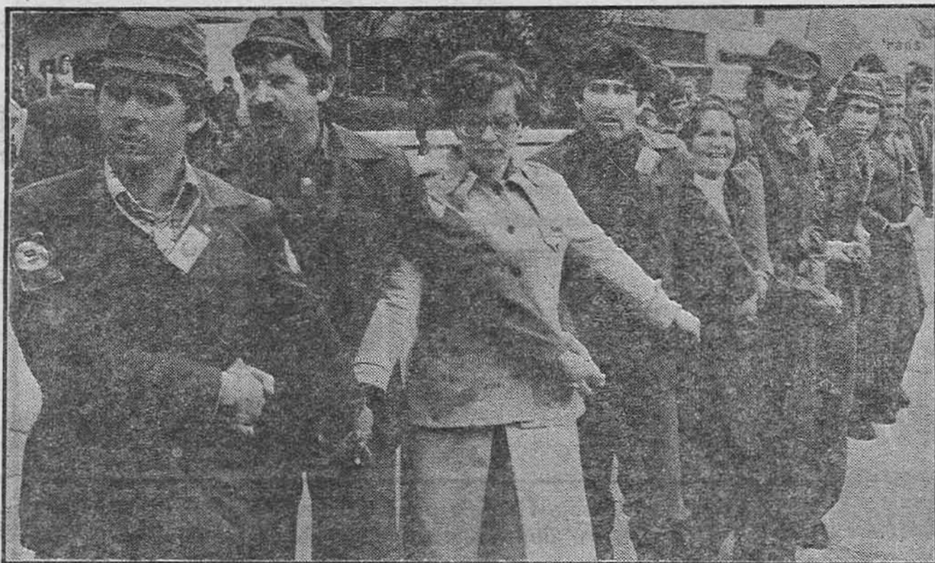
Ноло су заиграли ударници декаде