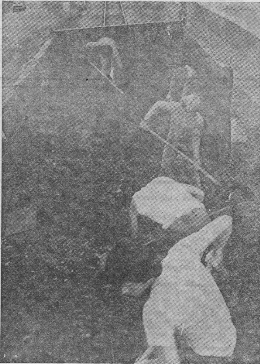
Вагони су зачас били ослобођени од туцанина