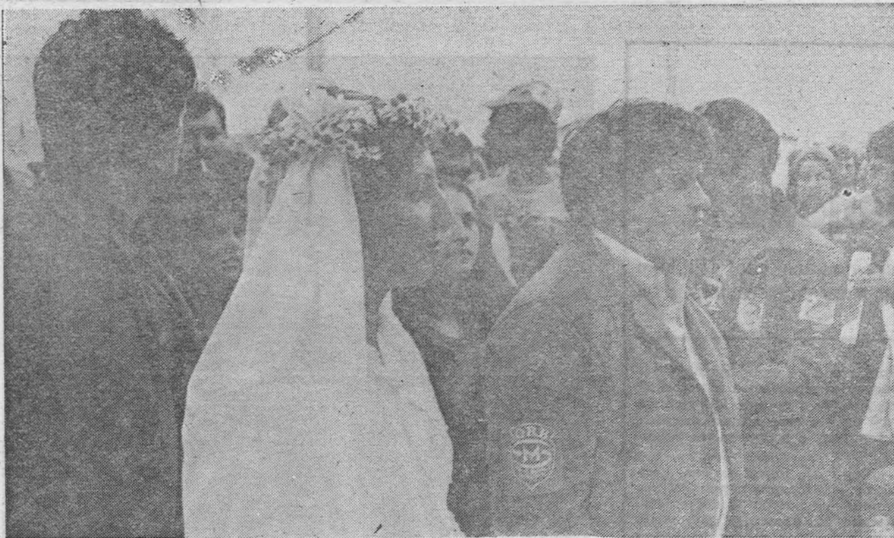
Pjevalo se i igralo kao na pravoj svadbi