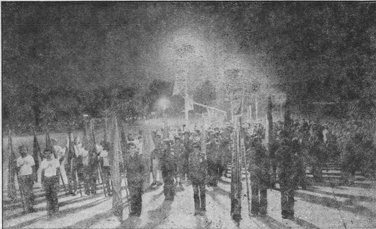
Akcija se nastavlja i kad smjene odlaze. Na trasi drugog kolosijeka nema zatišja ni onda kad se brigade smjenjuju. Svečani ispraćaj šeste smjene, poznate po visokim učincima, u isto vrijeme znači i susret sa novom, oktobarskom smjenom. Kontinuitet akcijaški ne prestaje dok se pruga ne završi. Tako to radi omladina na svojim akcijama. Sve mora da se okonča prije roka.

Doboj, 28. septembra 1978. UČESNICI ŠESTE SMJENE ORA »SAMAC — SARAJEVO 78«