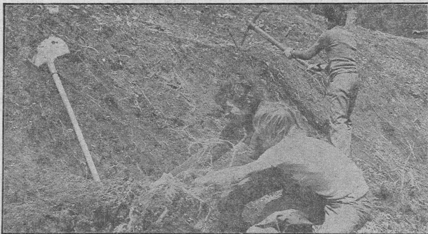
Brigadir i brigadirka ORB »Džemal Bijedić« na zajedničkom poslu