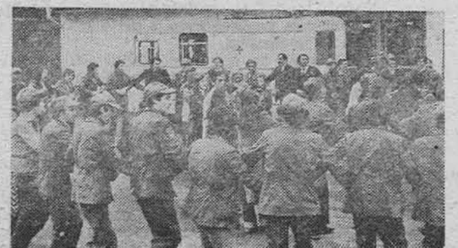
Над се посао заврши, насеље у Немилој ониви полом

У односу на прошлу годину, Вогошћа сада има пет пута више бригадирu. Толико интересовање постоји захваљујући, прије свега, успјесима 26 оmlадинских радних бригада које учествују у локалним радним акцијама »Ми граду — град нама«. Г. Ј.