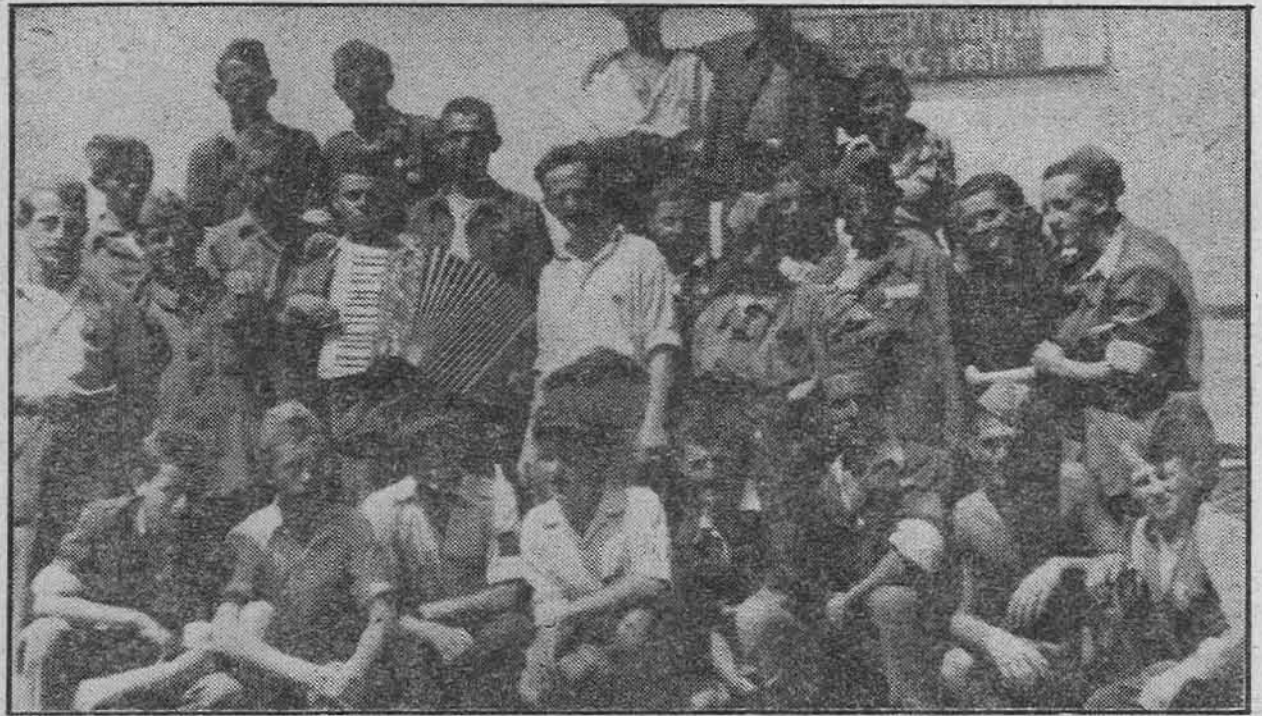
Омладина Босанског Шамца 1947. године на прузи

Тај 1. април 1947. године био је по много чему изузетан дан: сто двадесет радних бригада из свих крајева земље стигло је на анцију