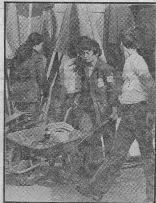
Stigli i falili se posla: brigadiri iz Gorenjskog

Jednoglasно је usvojen operativni plan друштвених активности, kućni red i jelovnik у насељу.