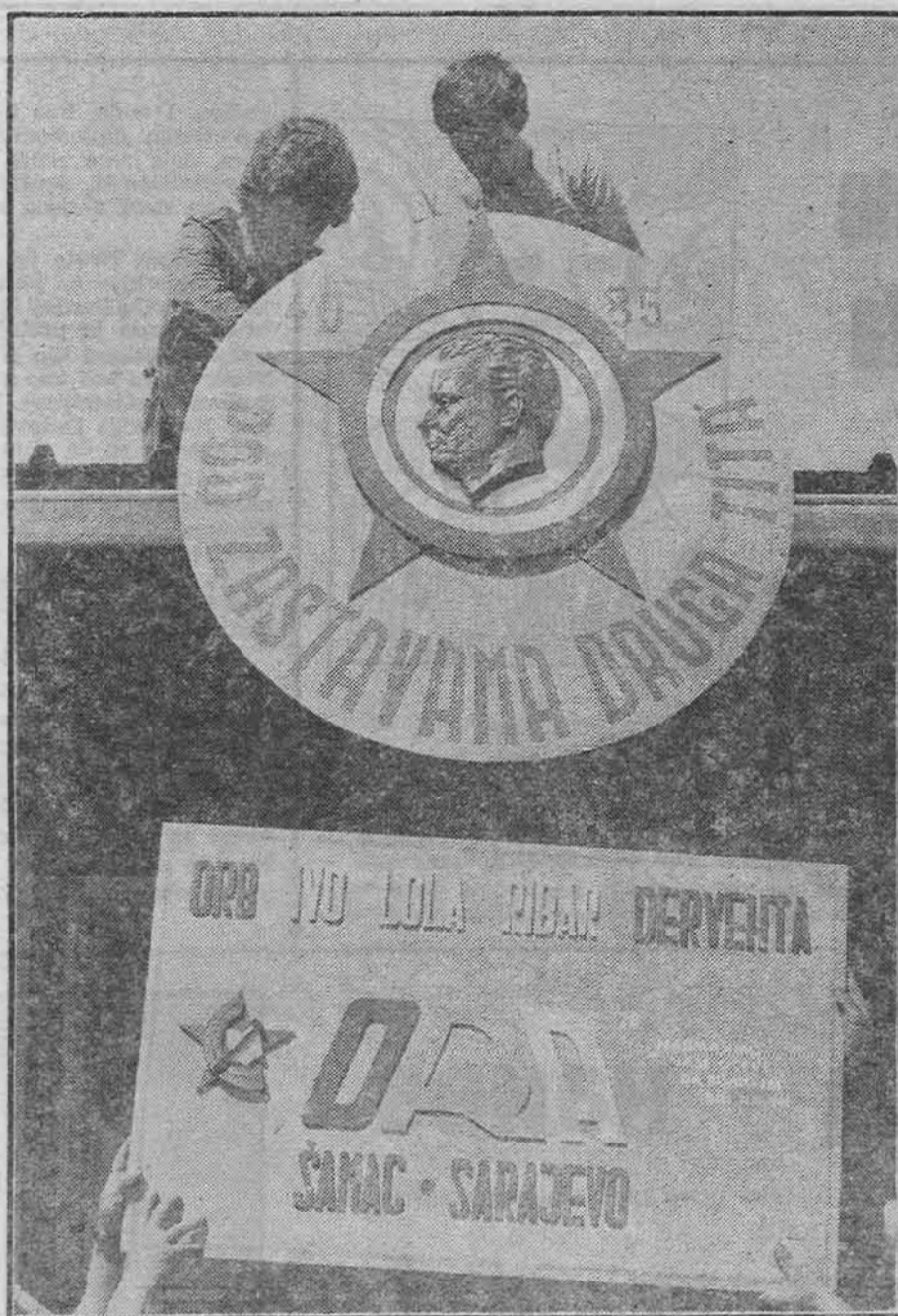
Omladinska radna brigada «Ivo Lola Ribar» iz Dervente smjestila se u žepču: Paviljon je ukrašen Titovim imenom