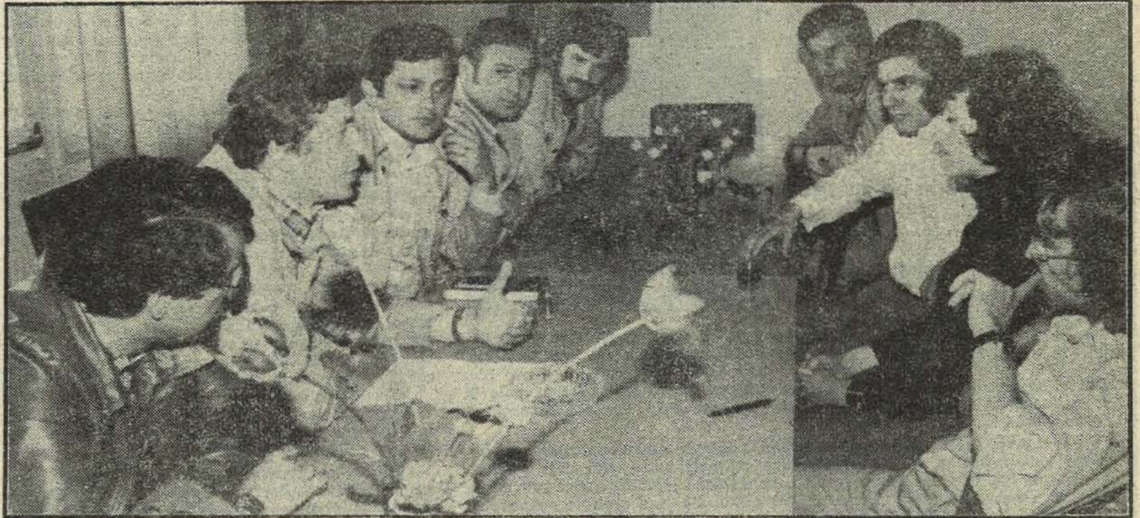
Гости из Мађарске за вријеме разговора у насељу Жепче

NEMILJA — Juče su brigadisti u naselju ORB u Nemiljoj gledali zajednički prenos sa dočeka Štafete u Sarajevu. S obzirom na to da je klub gdje se televizijski prijemnik nalazio bio mali da primi sve brigadiste, to je televizor bio stavljen na ljetnu pozornicu. Ovom TV prenosu prisustvovali su i gosti iz Mađarske koji su obilazili naselja omladinskih radnih brigada na drugom kolosijeku Šamac — Sarajevo.