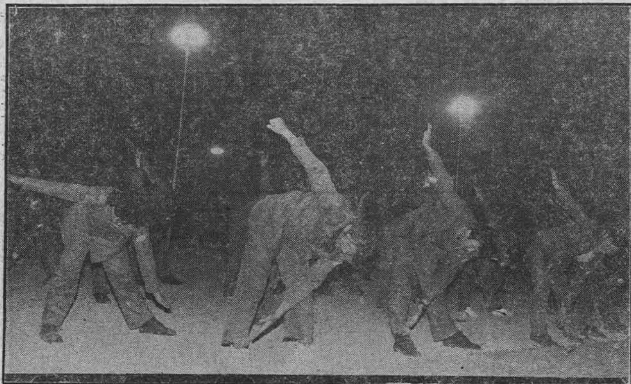
Један-два, ми смо војсна млада