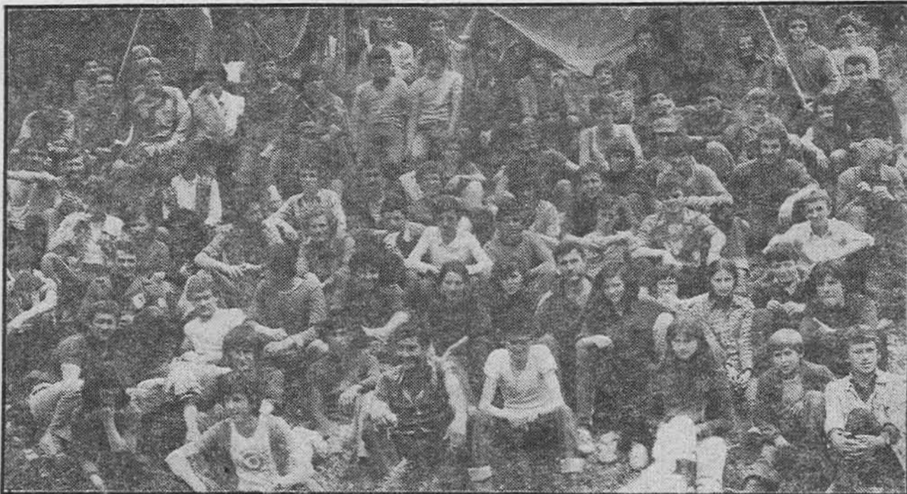
Višegradska brigada »Hamid Beširević« već na okupu