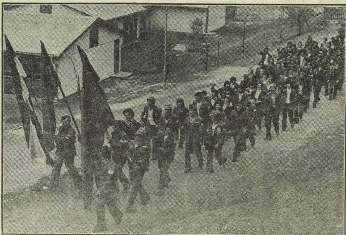
Насеље у Немилој примиће бригаду састављену од дјете наших радника који привремено бораве у СР Њемачкој

У ШТУТГАРТУ СВЕЧАНО ФОРМИРАНА ОМЛАДИНСКА РАДНА БРИГАДА «ЈУГОСЛАВИЈА»