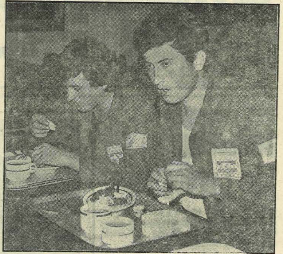
Na licima brigadira za ručkom osjeća se vrijeme rastanka