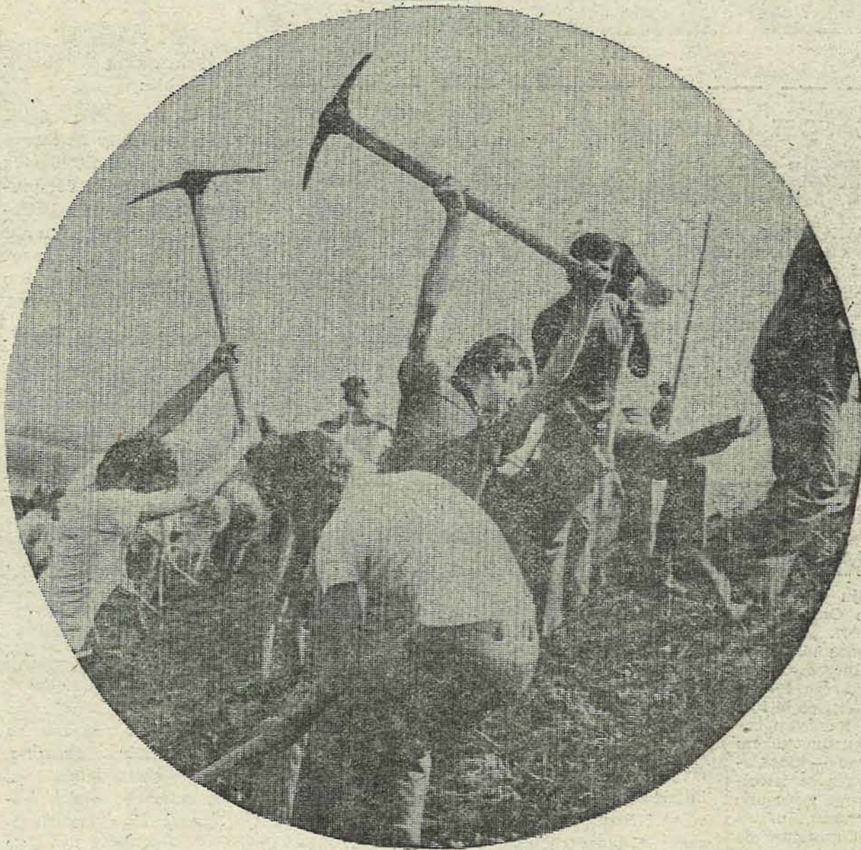
(Iz naselja u Zavidovićima)

Kada kiša ne dozvoljava svima izlazak na radilište, nužne poslove obavljaju oni koji ne žele da miruju