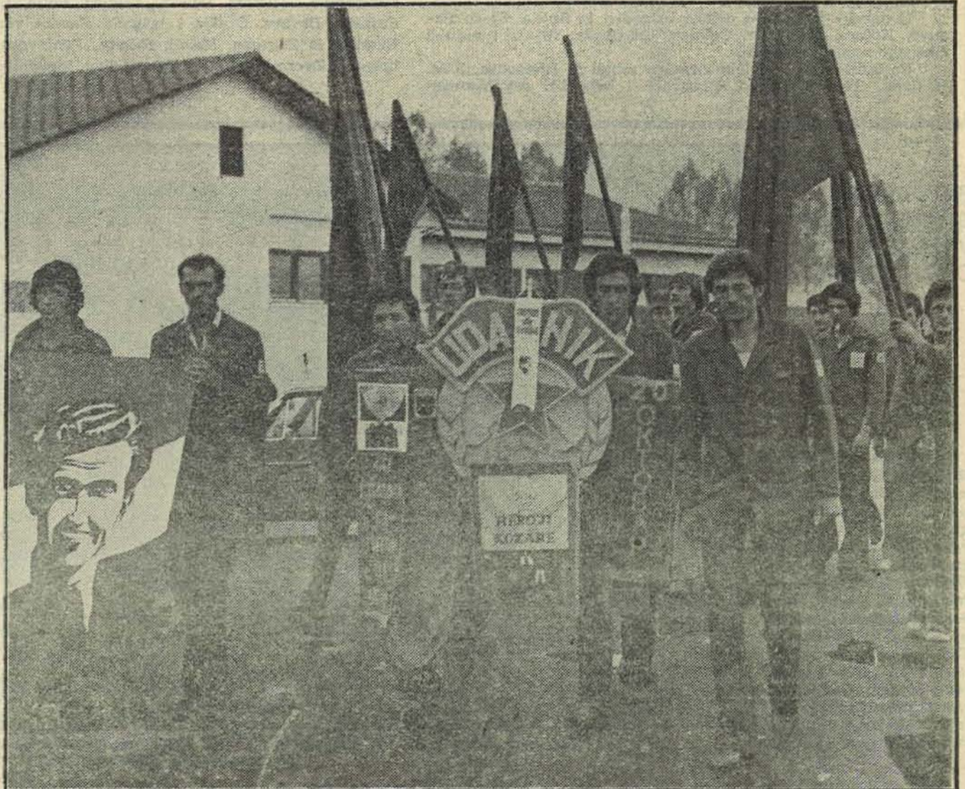
Svečani defile brigada u Žepču, prva i najbolja brigada »Ivo Lola Ribar« iz Dervente

Učesnici druge smjene ORA »Šamac-Sarajevo 78«