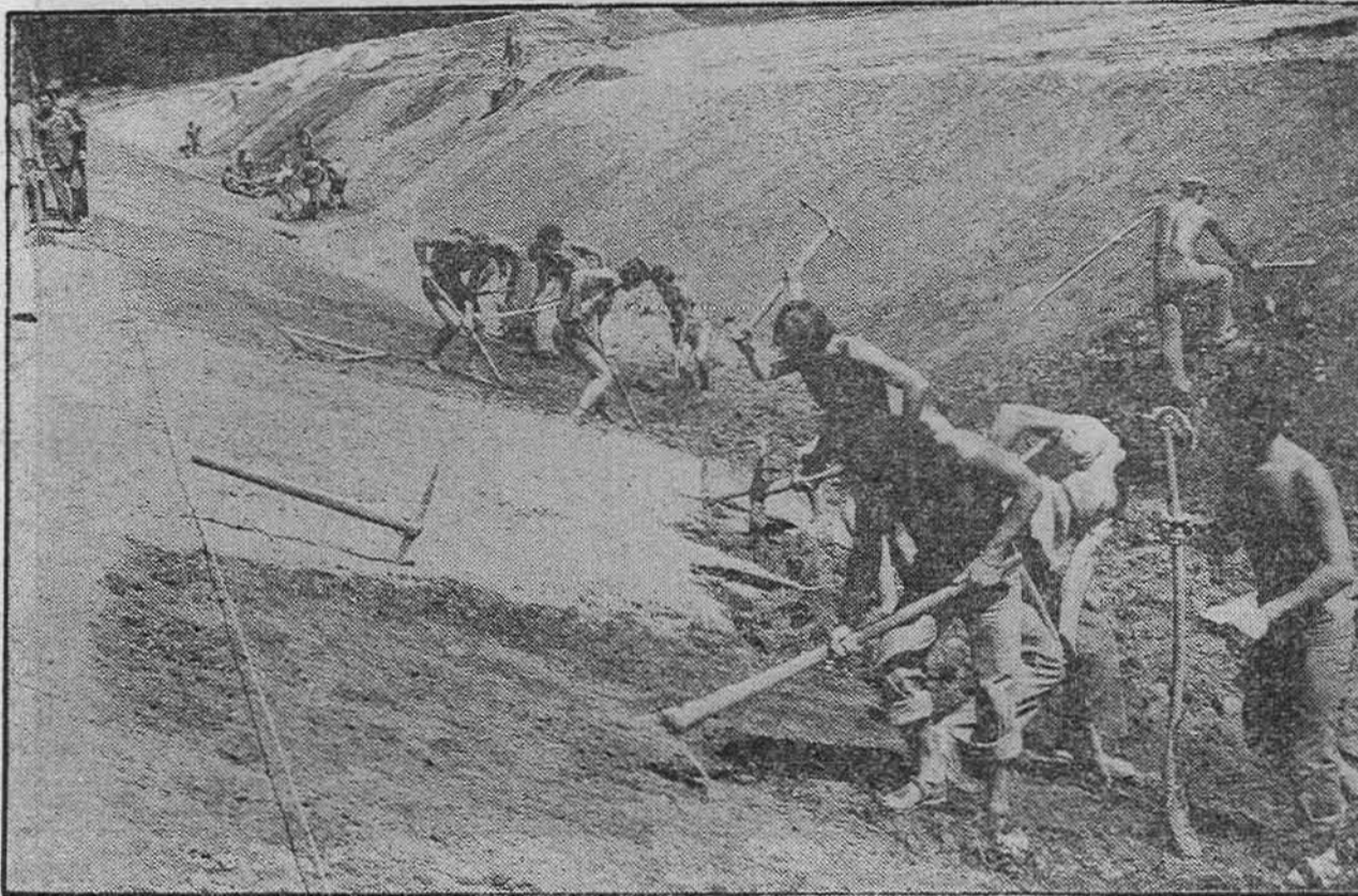
Sa prošlogodišnje akcije SORA »Sarajevo 77«