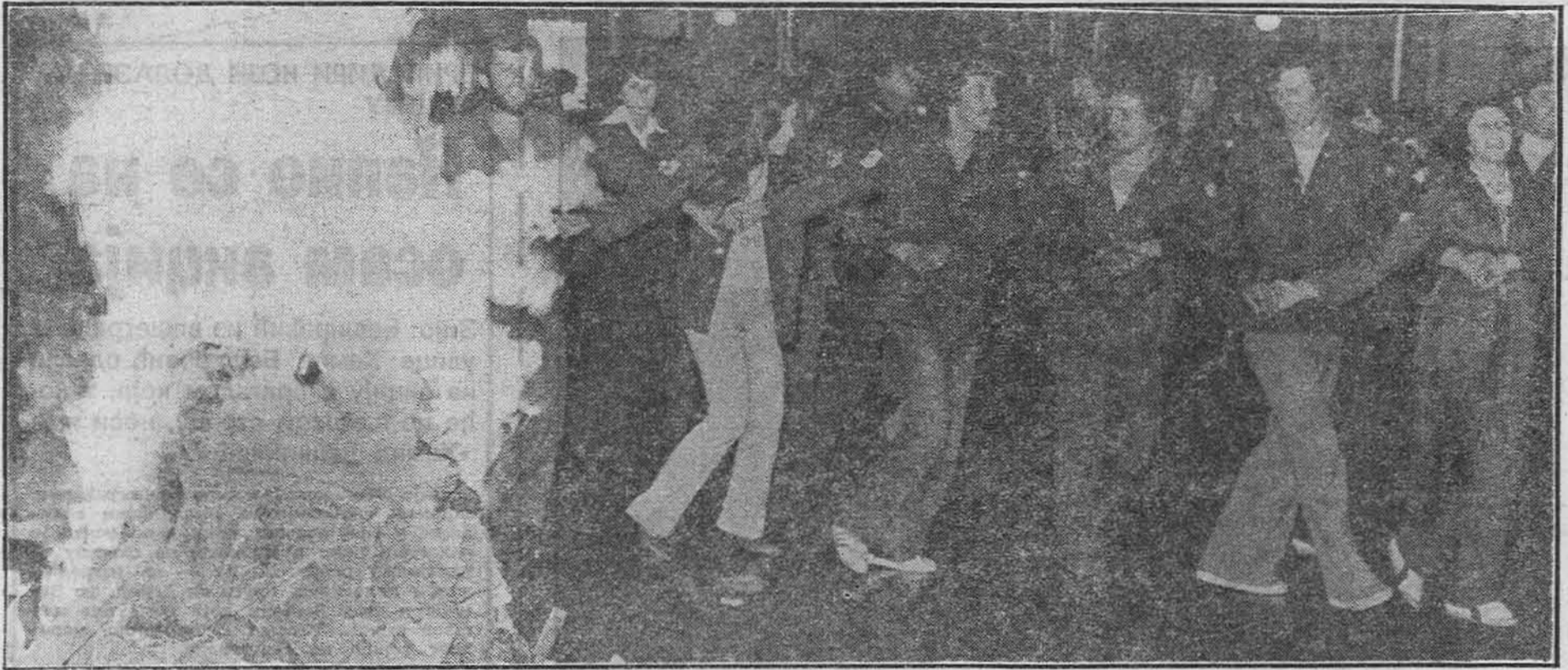
Бригадирско поло уз логорску ватру на свечаности поводом завршетна друге смјене у Завидовићима