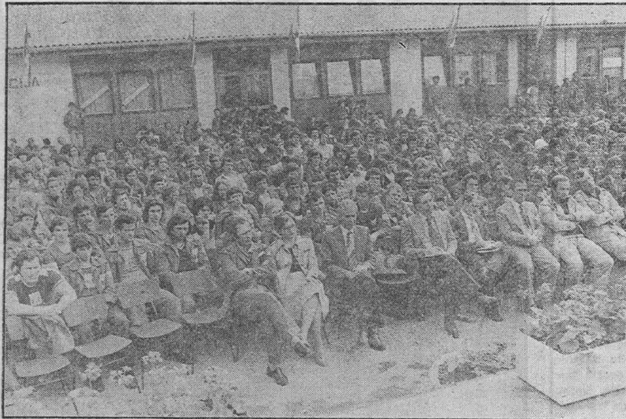
Растанак у Немилој — са свечаности поводом завршетка друге смјене

НЕМИЛА, 1. ЈУНА — Последње бригаде су отишле. Младићи и дјевојке, градитељи из друге смјене у Долини ударника, завршили су свој посао. Насеље у Немилој је опустјело, а још синоћ, пред љетном позоришном одржана је велика свечаност. Сви бригадисти, постројени и са заставама високо подигнутим изнад глава слушали су рјечи које им је упутио командант насеља Здра