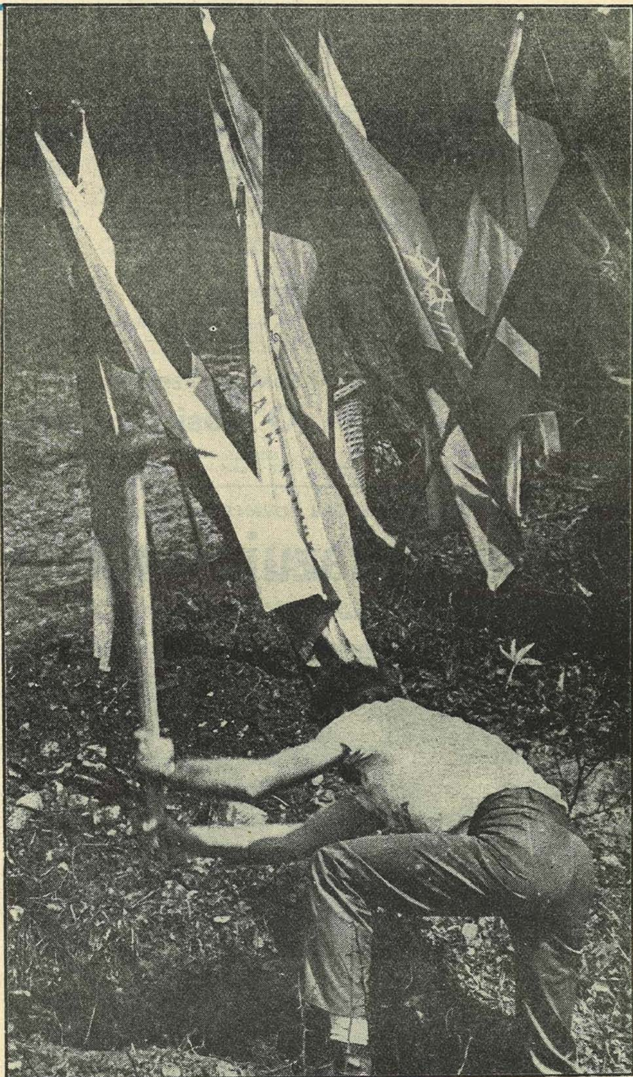
Zastave se vijore, a omladina iz treće smjene radi od prvog dana, trećoj smjeni je s početka i vrijeme naklonjeno