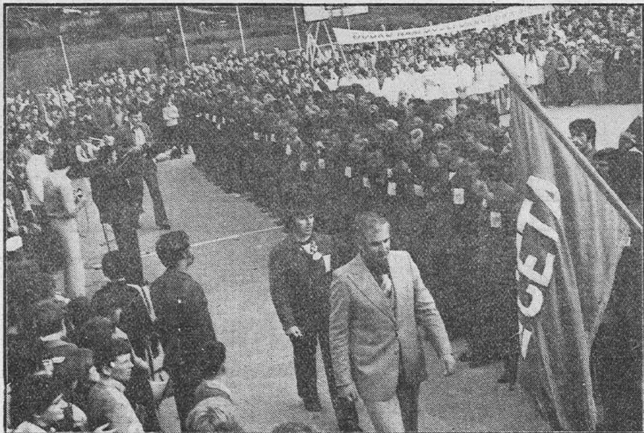
Smotru brigade izvršio je Novo Bahtac, sekretar OKSK Novi Travnik

Na povratku novotravničke ORB »Braća Ribar«