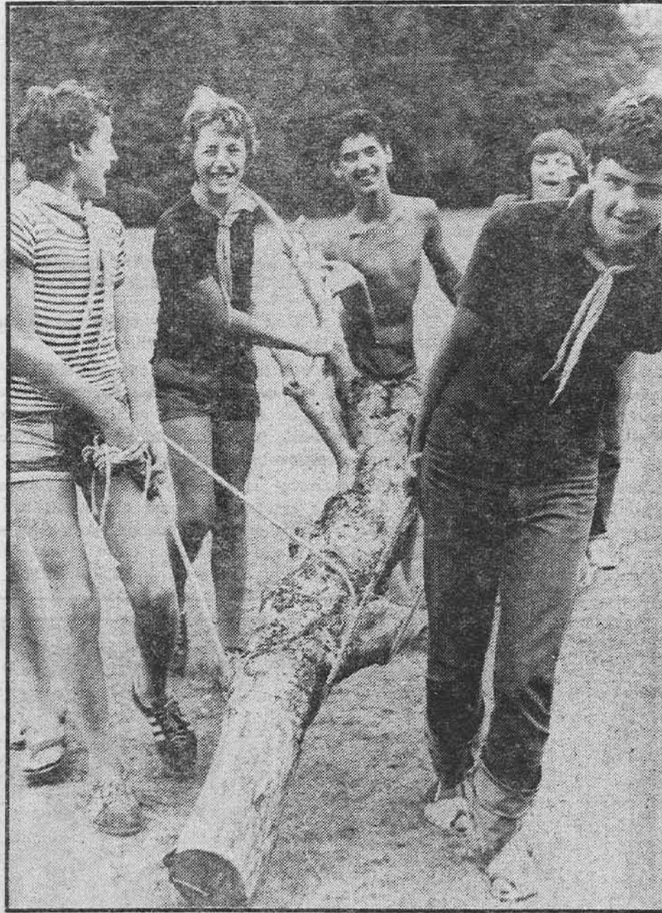
Članovi voda »Albatros« iz Odrada »Miljenko Cvitković« na radu

ŽELJE MLADIH RADNIKA PRIVREMENO ZAPOSLENIH U INOSTRANSTVU