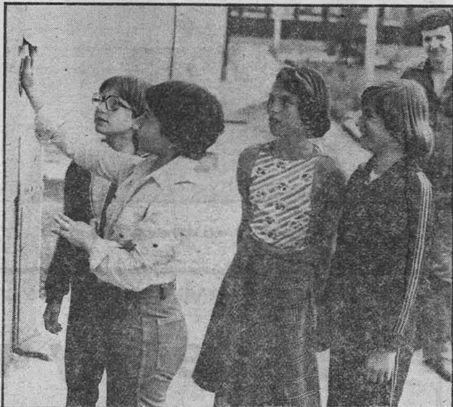
Pisali smo mami, neka čika poštar što prije pošalje pismo

Uključili smo se u razgovor. Rekoše nam da su iz Šarca. Mladi brigadir, onaj koji se srdio na zavidovićku poštu, taman što je zauštio da nam još nešto kaže, pozvaše ga iz Staba. Ima telefonski poziv. I, ode dječak, ne do vrši svoju misao. Možda je imao namjeru da nam kaže šta on misli da bi trebalo poduzeti protiv onih koji su ne-