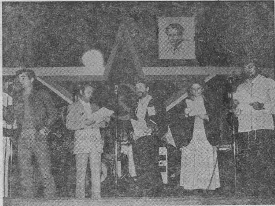
SA JAVNOG SNIMANJA EMISIJE CIK-ČAK