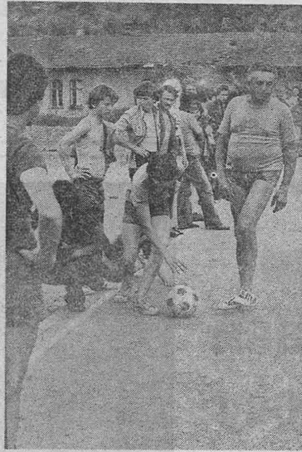
NEDJELJNI ODMOR U ŽEPAČKOM NASELJU