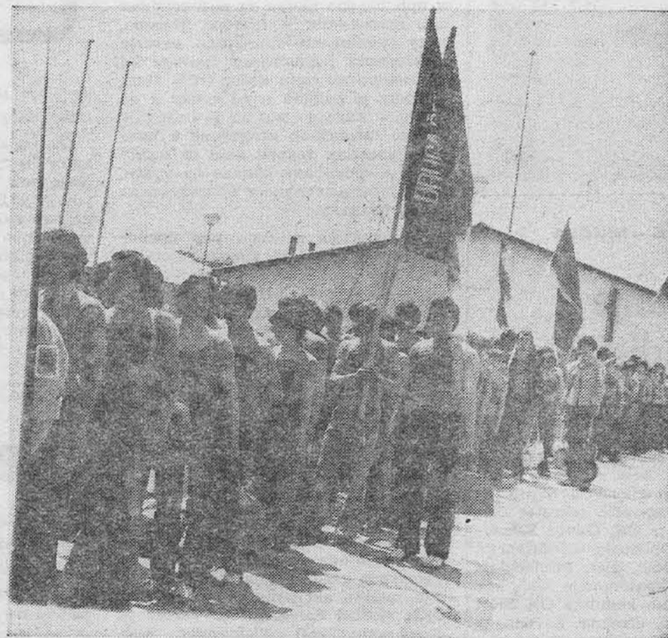
Brigadisti iz Viteza i Busovače dolaze u naselje ORB u Zavidovićima