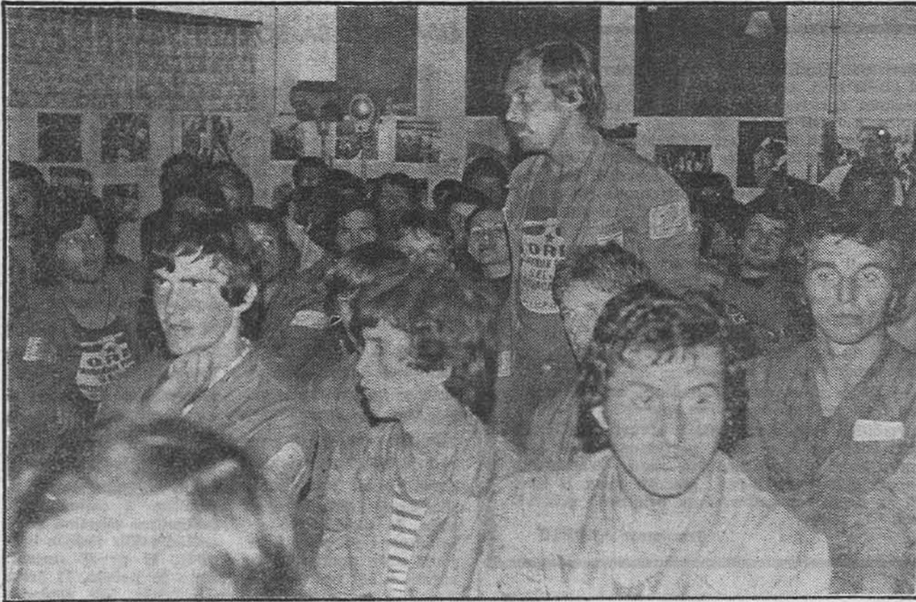
Са Бригадне конференције ОРБ «Слободан Принцип Сељо» — градитељи пруге стичу и самоуправна искуства