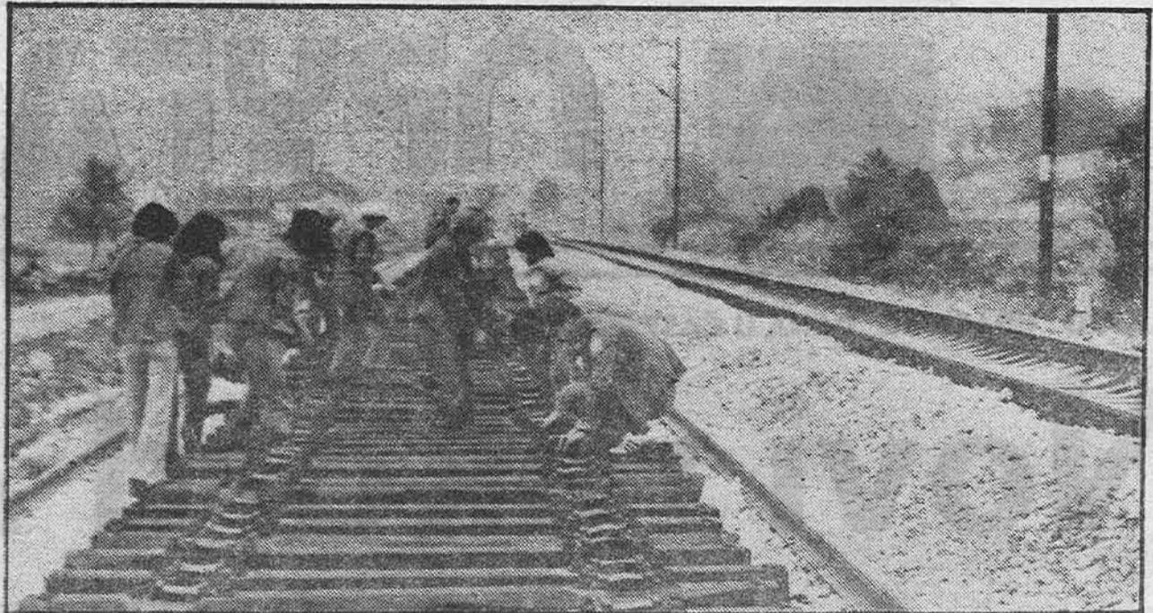
Pruga izrasta iz ruku brigadista kod Zavidovića

Specijalna udarna brigada, sastavljena od pionira, veterana i brigadista svih radnih jedinica naselja u Zavidovićima, postavila prve metre pruge