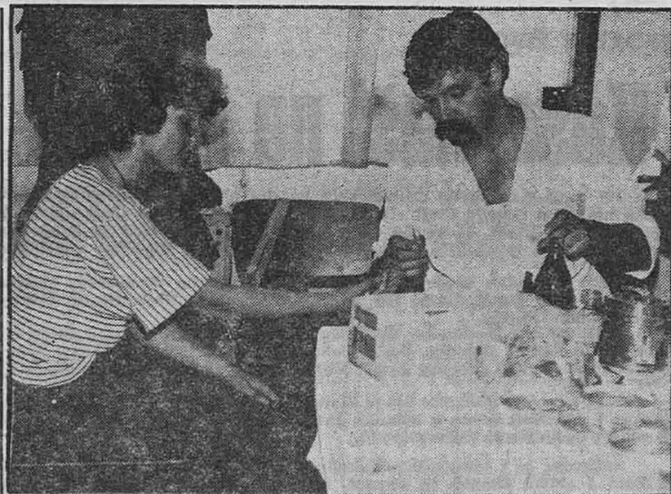
Dragocjenu tečnost dalo pedesetak omladinaca

Juče je u brigadirskom naselju SORA »Sarajevo 78«, u sklopu idejno-političkog obrazovanja, za sve brigadire održano predavanje o Metodu i sadržaju rada Saveza socijalističke omladine i društvenih organizacija koje okupljaju mlade. Ed. M.