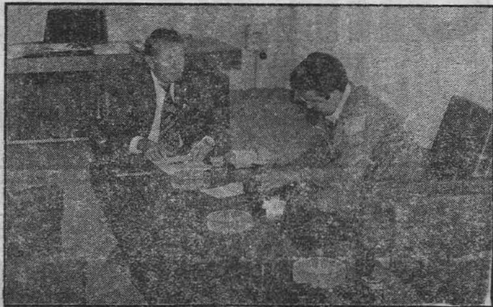
Predsjednik Skupštine opštine Doboj Bogdan Ostojić u razgovoru s našim saradnikom