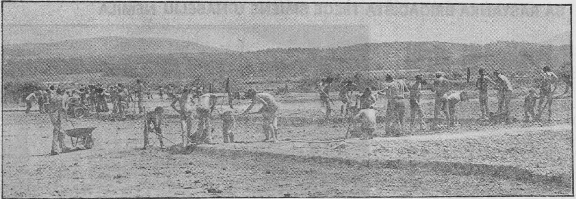
Vode Miljacke uskoro će teći novim koritom