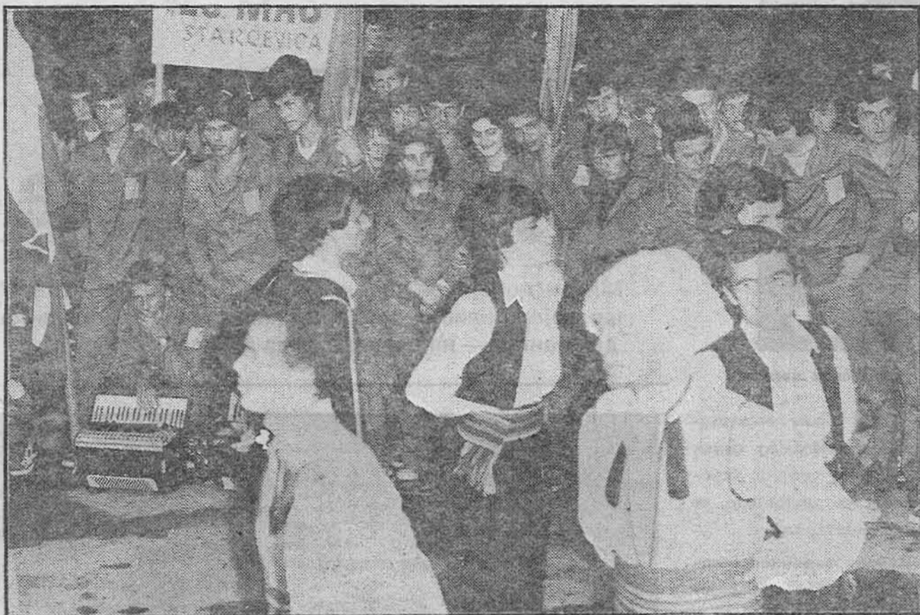
Brigadiste su na svečanosti zabavljali članovi gradskih kulturno-umjetničkih društava