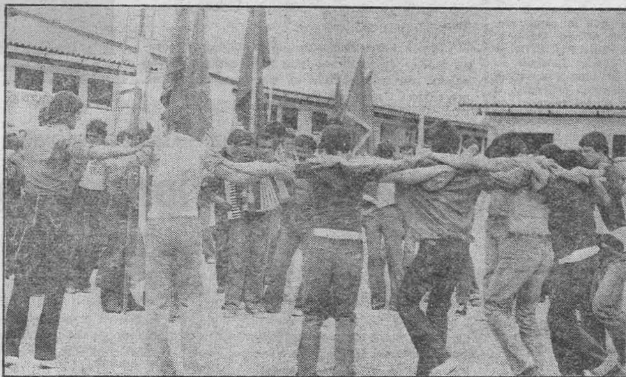
Kozaračko kolo kiseljačkih brigadista

Prva je stigla brigada »Štefan Kovač Marko« iz Murske Sobote. Gromoglasnim brigadnim pozdravom dočekali su ih brigadiri iz Kiseljaka koji su stigli dan ranije. Slijedile su omladinske radne brigade »Simela Šolaja« iz Šipova, brigada Ratnog vazduhoplovstva »Viktor Bubanjić«, »Đura Kiš« iz Šida, »Slobodišće« iz Kruševca, »Goce Metalac« iz Skoplja, »Bratstvo-jedinstvo« iz Ivanjić-Grada i Brigada veterana, koja je stigla posljednja i bila najsrdačnije dočekana od strane svih brigada čiji su im pripadnici odali zasluženu počast.